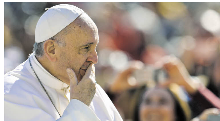
Franziskus fliegt trotz Anschlägen nach Ägypten.