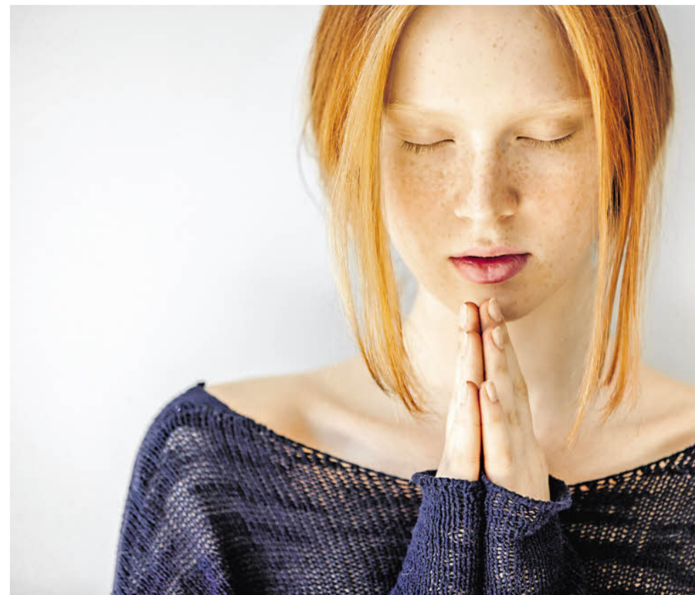
Viele Junge kreieren ihre Religiosität selbst.

Damit bleiben religiöse Gruppen und Kollektive auch für die öffentliche Ordnung relevant – sowohl als Ressource wie auch als Gefährdung. Keine andere Instanz kann den Menschen derart „in Beschlag nehmen“: Religion kann zu höchster